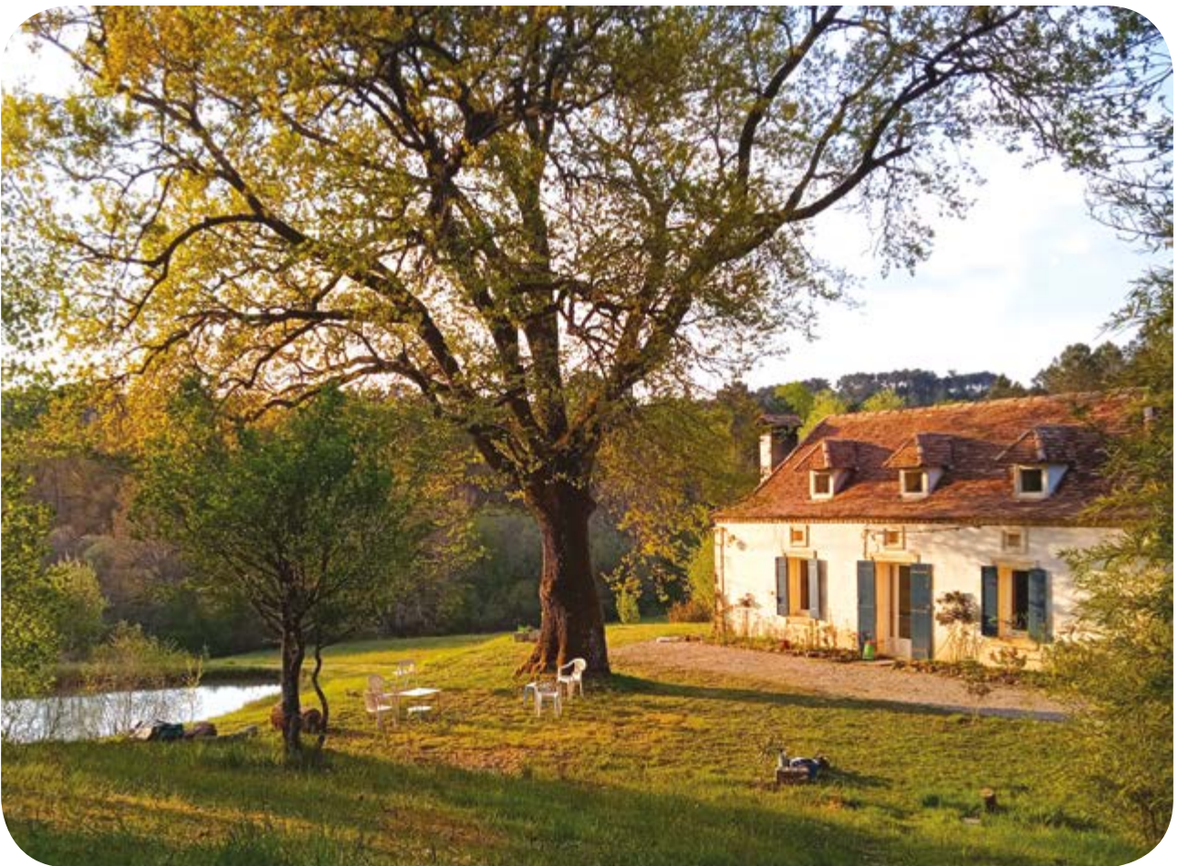
Le lieu-dit 'Les Combettes'.