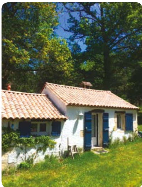
Le gîte, à deux pas de chez Sylvie, petit coin de nature...