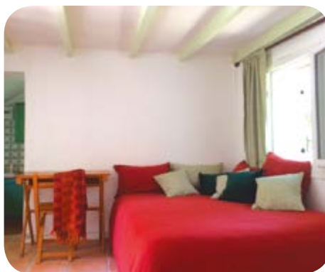
Un grand lit pour la nuit,