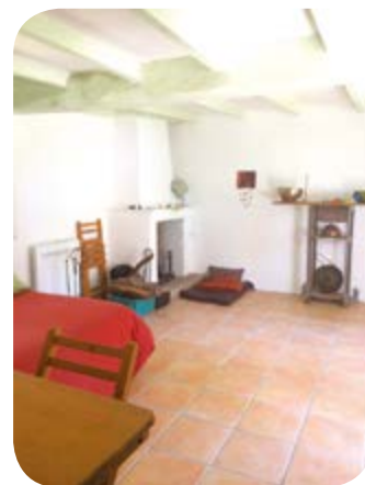
ou lézarder au coin du feu.