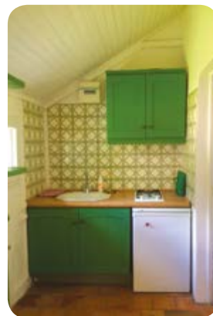
une cuisine à Soi,